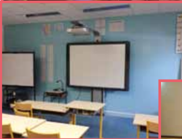
Vie scolaire et périscolaire