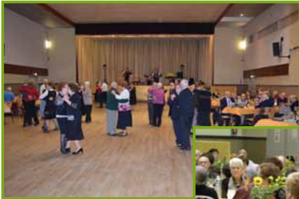
Repas des anciens

Comme tous les ans, le Blainvillois vous propose une rétrospective toute en images de l'année passée. Sans être exhaustive, cette liste regroupe des moments marquants de la vie sociale, culturelle ou sportive en 2013.