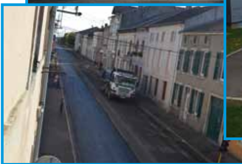
Aménagements de la Commune