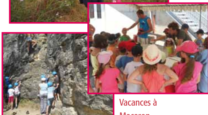
Vacances à Macaron