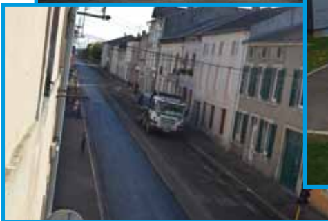
Aménagements de la Commune