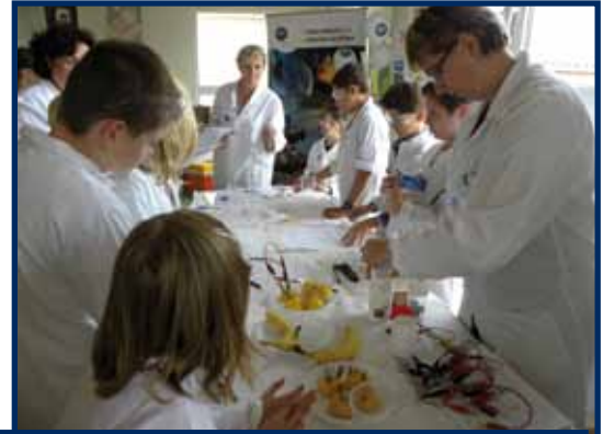
Ateliers de la Médiathèque