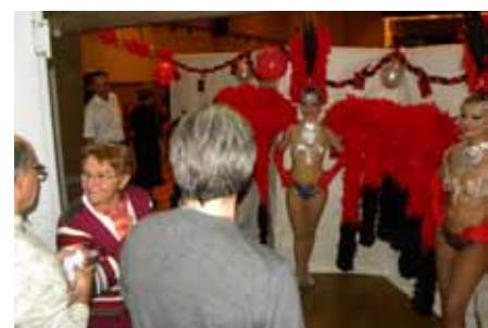
Nouvelle soirée cabaret avec plus de 340 personnes pour un moment exceptionnel.