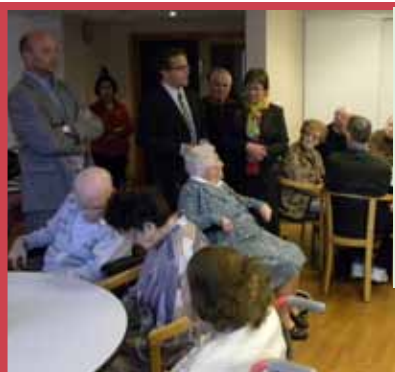
La doyenne de Blainville-sur-l'Eau a 100 ans. Un anniversaire devenu un événement pour une dame toujours bon pied bon oeil.

Le défi sera difficile à relever : faire mieux en 2010 !