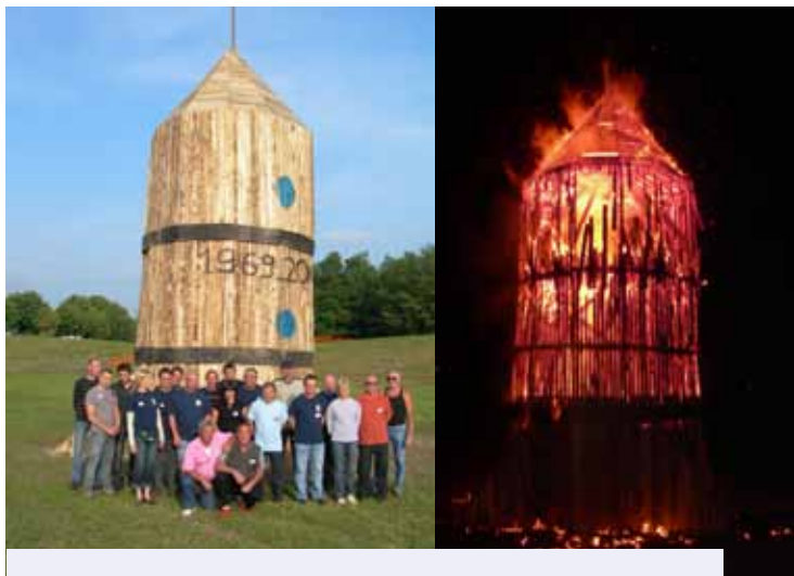
Les feux de la Saint-Jean, et un projet un peu fou, la construction d'une fusée pour célébrer les 40 ans de l'alunissage de Neil Armstrong.