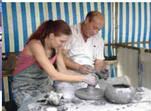
Journées Européennes du Patrimoine, une sublime exposition de faïences avec démonstrations et ateliers, tout le monde a pu mettre les mains dans la terre !!