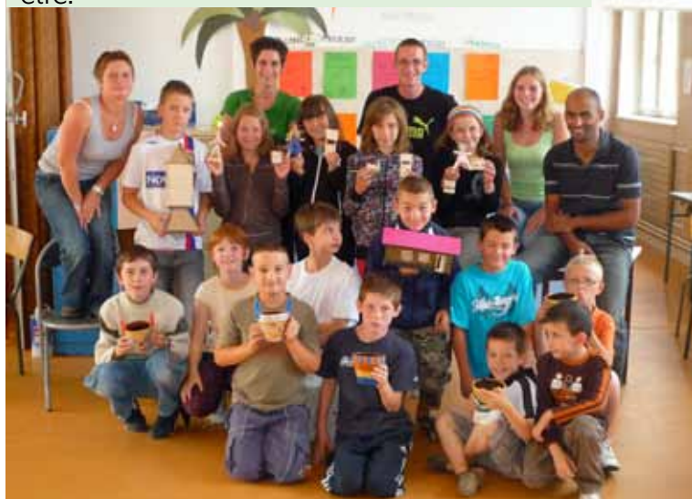
Activités d'été, vacances avec les copains, les sourires d'un centre de loisirs où il fait bon être.