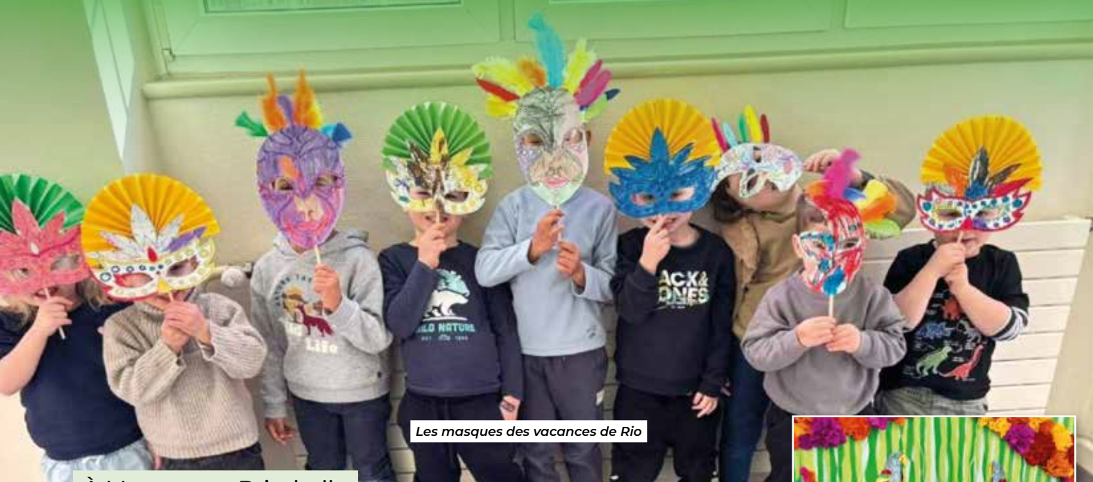
Les masques des vacances de Rio