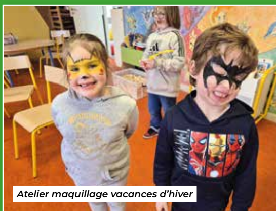
Atelier maquillage vacances d'hiver

Ils ont eu l'occasion de présenter leurs costumes lors d'un petit spectacle à l'Accueil de jour de Blainville-sur-l'Eau.