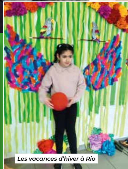
Les vacances d'hiver à Rio