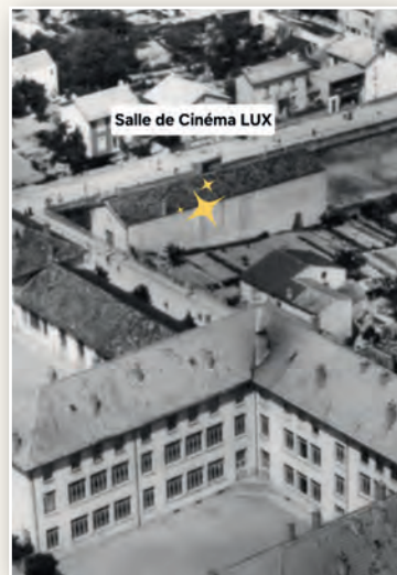
Salle de Cinéma LUX

Suite à la fermeture du cinéma, le bâtiment a accueilli ensuite des associations dont l'école de judo de Blainville-Damelevières, créée dans les années 1950 pour des sportifs de 4 à 90 ans. Une salle pour un stand de tir y est également ouverte.