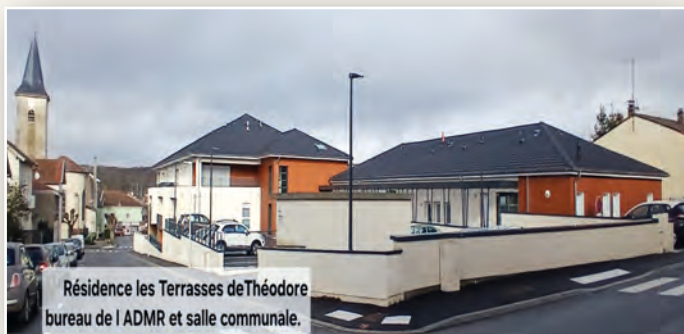
Résidence les Terrasses deThéodore bureau de l ADMR et salle communale.

En mai 2021, avant la démolition des bâtiments, l'association du patrimoine récupère les couvertines et quelques belles pierres du mur de clôture. Elles sont conservées afin de servir à un futur chantier.