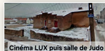
Cinéma LUX puis salle de Judo